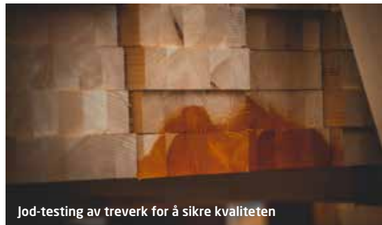
Jod-testing av treverk for å sikre kvaliteten