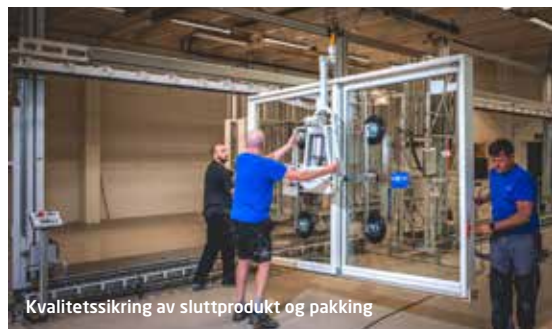
Kvalitetssikring av sluttprodukt og pakking