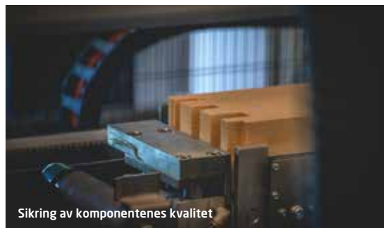
Sikring av komponentenes kvalitet