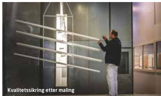
Kvalitetssikring etter maling